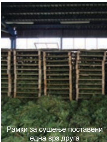
Рамки за сушење поставени една врз друга