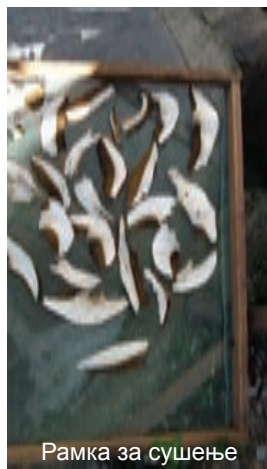
Рамка за сушење