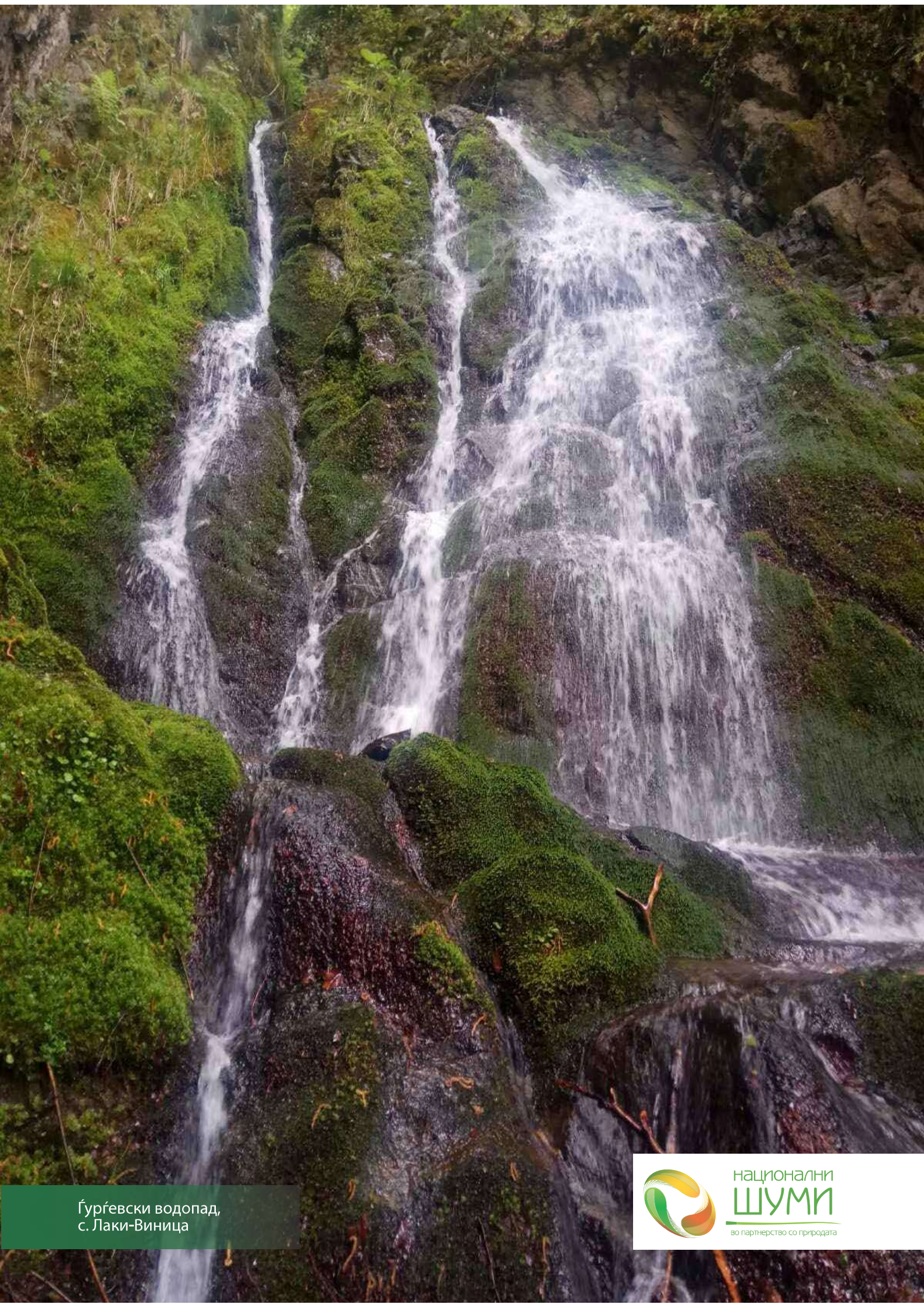
Ѓурѓевски водопад, с. Лаки-Виница