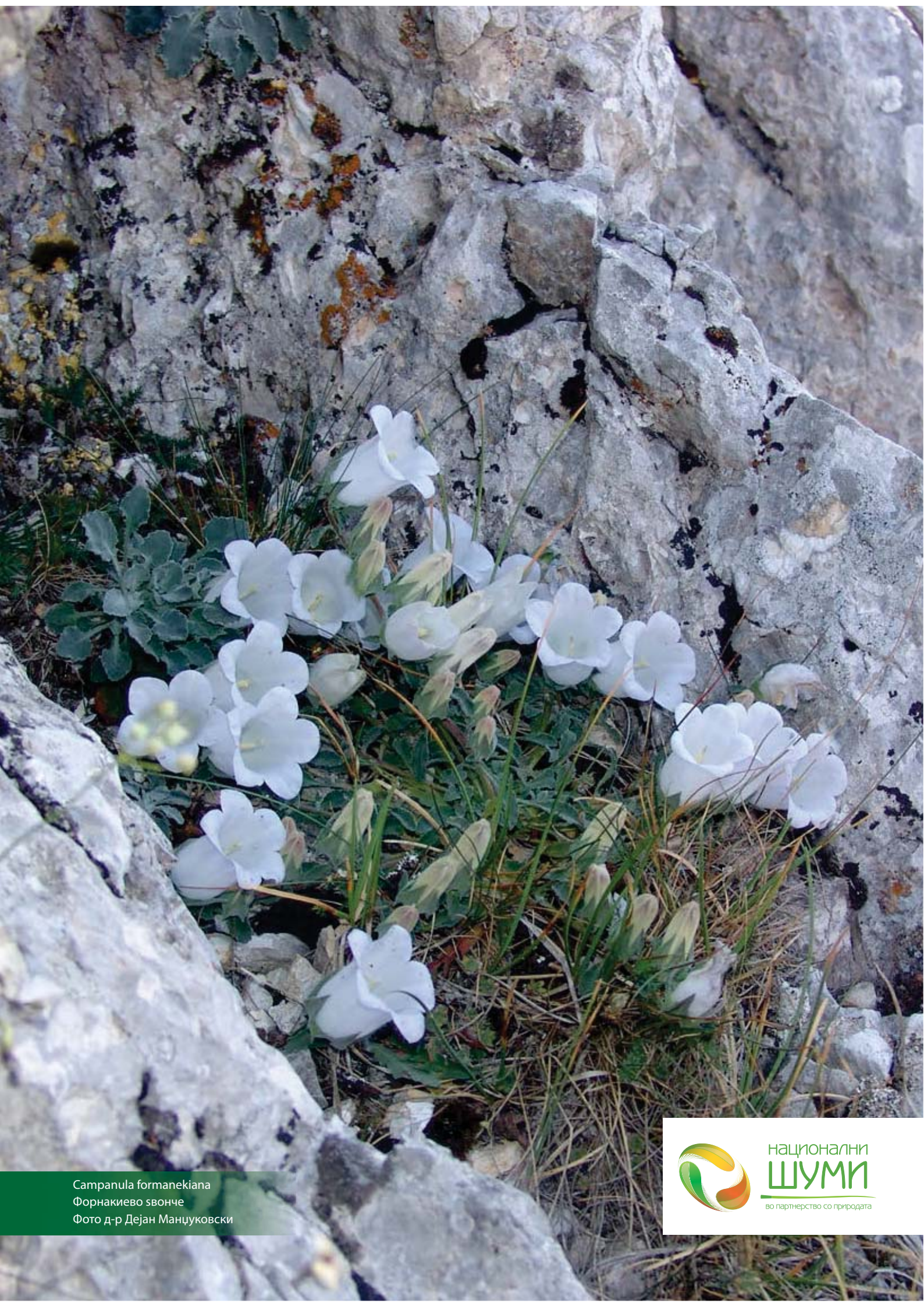
Samranula formanekiana Форнакиево звонче