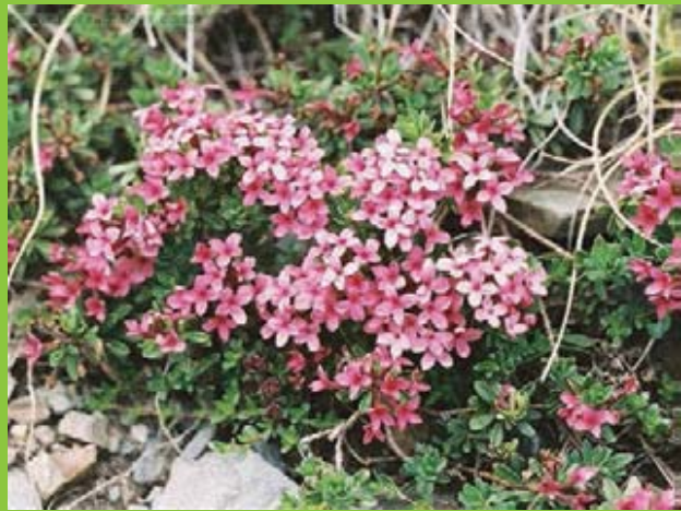
Лево - детал од цвет ; Десно - природен хабитус