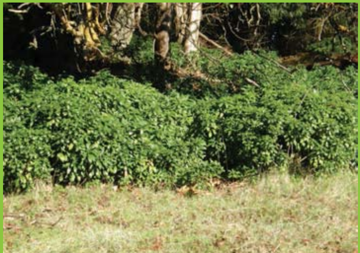
Лево - детал од цвет; Десно - природен хабитус;