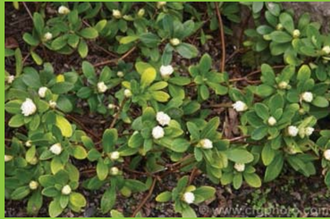
Лево - детал од цвет ; Десно - природен хабитус;