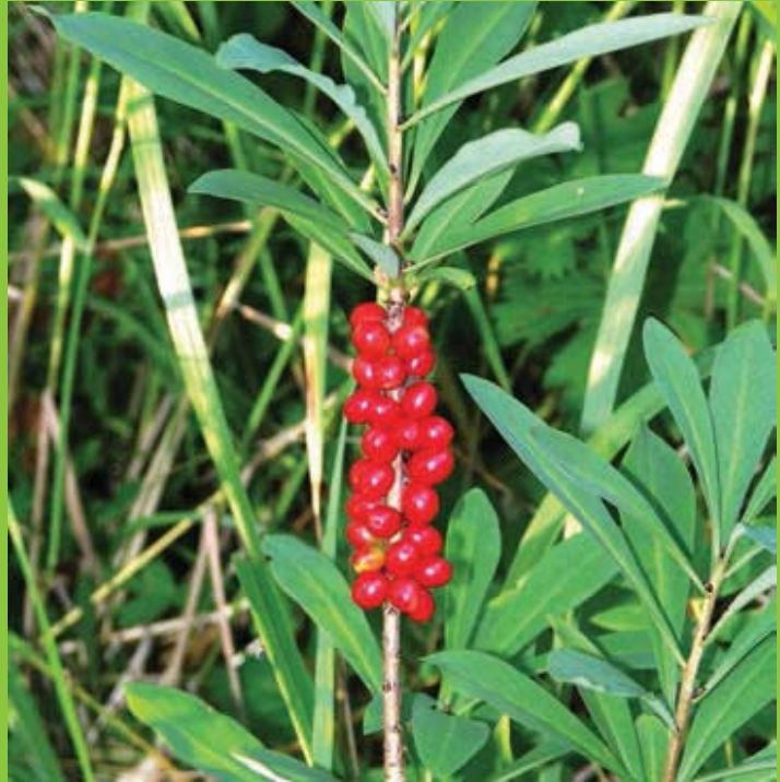
Лево - детал од цвет ; Десно - плод