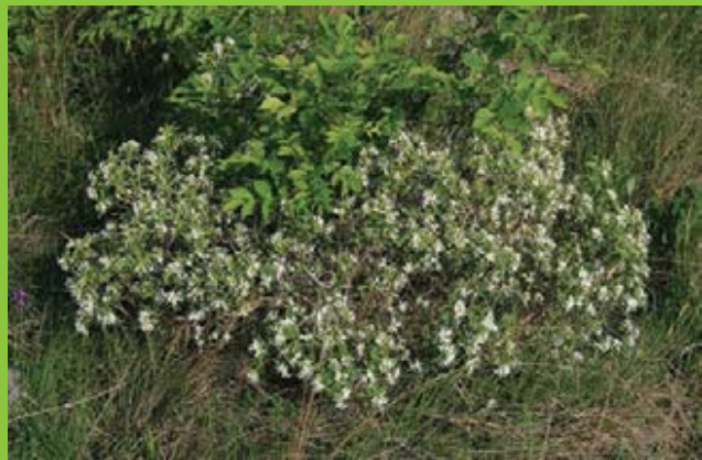
Колаж од детали на D. alpina