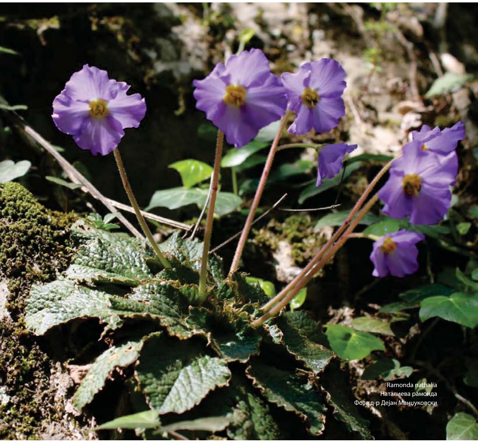
Ramonda nathalia Наталиева рамонда